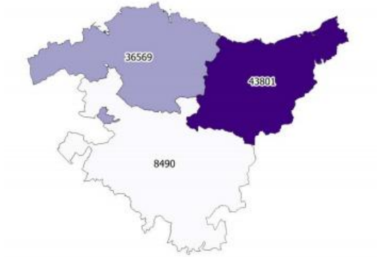
Mapa 33: Empleo de la Economía Social. 2018